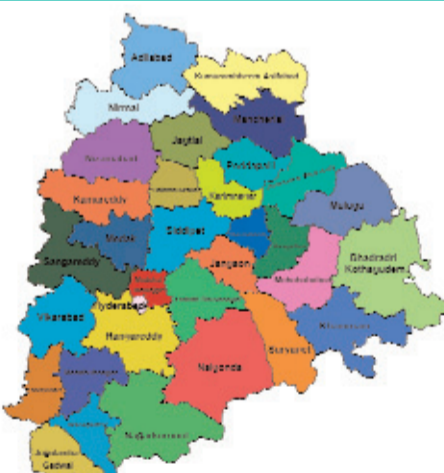
తెలంగాణ కాంగ్రెస్ శ్రేణుల్లో కొత్త

హైదరాబాద్ - ప్రభాత సూర్యుడు కర్ణాటక ఎన్నికల తర్వాత తెలంగాణ రాజకీయాల్లో వేగంగా మార్పులు మొదలయ్యాయి. తెలంగాణపై రెండు ప్రధాన జాతీయ పార్టీలు బీజేపీ, కాంగ్రెస్ ఫోకస్ పెంచాయి. కర్ణాటక ఫలితాలనే తెలంగాణలోనే రిపీట్ చేస్తామని కాంగ్రెస్ నేతలు ధంకా బజాయించి చెబుతున్నారు. రాహుల్ గాంధీ అయితే ఏకంగా అమెరికా పర్యటనలో హూంకారమే చేశారు. తెలంగాణ నుంచి బీజేపీని ఊడ్చి పారేస్తామని ఆయన భీషణ ప్రకటన చేశారు. తద్వారా