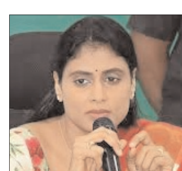
పై మెట్టుకు తీసుకు పోయారు. బీజేపీని మూడవ స్థానంలోకి నెట్టేశారు. అదే సమయంలో బీజేపీలో

తెలంగాణ రాజకీయాలు రోజురోజుకూ వేడెక్కుతున్నాయి. కొత్త ఎత్తులు, కొత్త పొత్తులు తెరపై కొస్తున్నాయి. సమీకరణాలు వేగంగా మారుతున్నాయి. ముఖ్యంగా కర్ణాటక ఎన్నికలలో కాంగ్రెస్ పార్టీ అద్భుత విజయంతో లెక్కలు మారిపోయాయి. అంత వరకు తెలంగాణ రాజకీయాలలో మూడవ స్థానంలో ఉందని బీజేపీని మూడవ స్థానంలోకి అనుకున్న వాస్తవం పార్టీని విశేషము