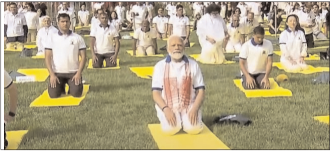
న్యూయార్క్- ప్రభాత సూర్యుడు

అంతర్జాతీయ యోగా దినోత్సవం సందర్భంగా ప్రధాని నరేంద్ర మోదీ భారత ప్రజలనుద్దేశించి ఆమెరికా నుంచి ప్రసంగించారు. వీడియో సందేశం ద్వారా మీ ఆందరితో కనెక్ట్ అవుతున్నానని, కానీ యోగా కార్యక్రమం మీన్ కావడం లేదన్నారు ప్రధాని మోదీ. భారత కాలమానం ప్రకారం సాయంత్రం 5.30 గంటలకు ఐక్యరాజ్యసమితి ప్రధాన కార్యాలయంలో జరిగే భారీ యోగా కార్యక్రమంలో పాల్గొంటాను అన్నారు. భారత్ పిలుపు మేరకు ప్రపంచంలోని 180కి పైగా దేశాలు ఏకతాటిపైకి రావడం చారిత్రాత్మకం అని అభిప్రాయపడ్డారు. 2014లో ఐక్యరాజ్యసమితి జనరల్ అసెంబ్లీలో అంతర్జాతీయ యోగా దినోత్సవం ప్రతిపాదన వచ్చినప్పుడు రికార్డు స్థాయిలో దేశాలు మద్దతిచ్చాయి. అప్పటి నుంచి అంతర్జాతీయ యోగా దినోత్సవం ద్వారా యోగా ప్రపంచ