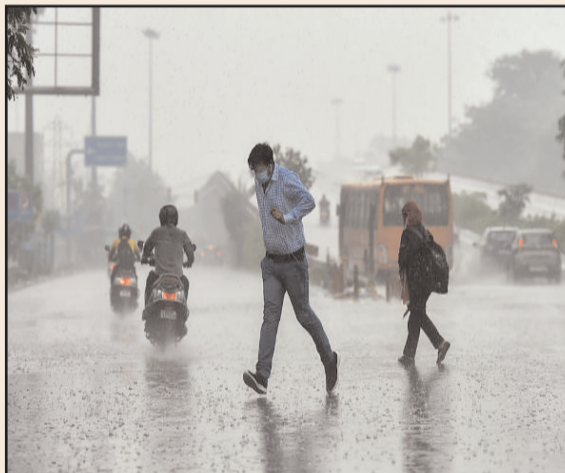
హైదరాబాద్ - ప్రభాత సూర్యుడు