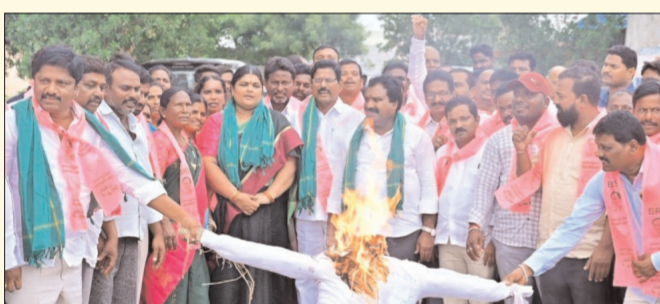
హైదరాబాద్ - ప్రభాత సూర్యుడు

తెలంగాణ వ్యాప్తంగా బీఆర్ఎస్ నేతలు రోడ్లపైకి వచ్చారు. మంత్రులు, ఎమ్మెల్యేలు, ఎంపీలు, లోకల్ లీడర్ల అంతా తెలంగాణ పీసీసీ చీఫ్ చేసిన కామెంట్లపై గుర్తు అయితున్నారు. అధికారంలోకి రాక ముందే కాంగ్రెస్ తన నిజస్వరూపాన్ని