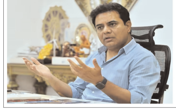
హైదరాబాద్ - ప్రభాత సూర్యుడు

తెలంగాణలో పచ్చదనం 8 శాతం పెరిగినట్లు మంత్రి కేటీఆర్ పేర్కొన్నారు. దేశంలో ఏ రాష్ట్రంలోనూ ఈ స్థాయిలో గ్రీనరీ పెరగలేదని, తెలంగాణలో గ్రీనరీ పెరిగిన శాతం అత్యధికంగా ఉన్నట్లు ఆయన తెలిపారు. తెలంగాణలో పచ్చదనం మూడు శాతం పెరిగినట్లు గ్రీన్ బెల్ట్ అండ్ రోడ్ ఇన్వెస్టిగ్యాట్ ప్రెసిడెంట్ ఎంకెఎల్ సోలీమామ్ ఓ ట్వీట్ చేశారు. ఆ ట్వీట్లో తెలంగాణ సర్కార్ చేపడుతున్న హరితహారాన్ని ఆయన ప్రశంసించారు. తెలంగాణ తన గ్రీనరీని మూడు శాతం పెంచుకుందని, ఇదో అద్భుతమైన పయత్నమని ఆయన అన్నారు. ఎంకె తన ట్వీట్లో ఓ వీడియో పోస్టు చేశారు. ఇలాంటి హై క్వాలిటీ ఉన్న మొక్కల్ని నాటడం వల్లే ఆ గ్రీనరీ పెరిగినట్లు ఎంకె తన ట్వీట్లో అభిప్రాయపడ్డారు. ఆరోగ్యకరమైన మొక్కల్ని మళ్లీ ఈ సీజన్లోనూ నాటేందుకు తెలంగాణ ప్రభుత్వం సిద్ధంగా ఉన్నట్లు ఎంకె తన ట్వీట్లో తెలిపారు.