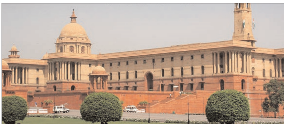
హైదరాబాద్ - ప్రభాత సూర్యుడు

కేంద్ర మంత్రి వర్గ విస్తరణ ఉంటుందని జోరుగా ప్రచారం జరుగుతోంది. మొత్తం 22 మందిని తొలగించి వారి స్థానంలో కొత్త వారికి ఛాన్స్ ఇస్తారని తెలుస్తోంది. ఏపీ, తెలంగాణ నుంచి ఎవరికి అదృష్టం వరిస్తుందో అని ఆసక్తి నెలకొంది. కేంద్ర కేబినెట్ లో మార్పులు