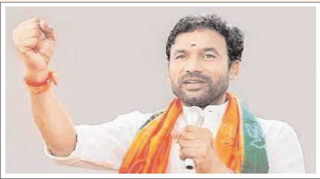
హైదరాబాద్ - ప్రభాత సూర్యుడు