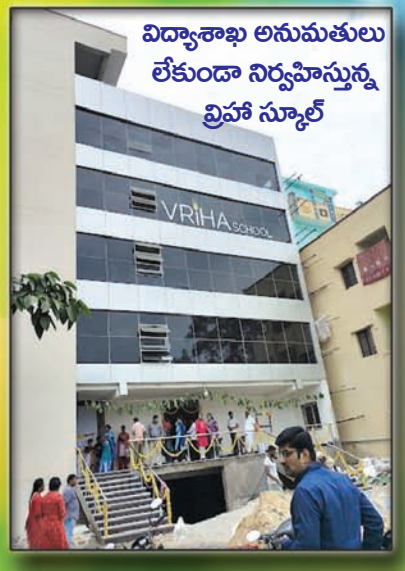
విద్యాశాఖ అనుమతులు లేకుండా నిర్వహిస్తున్న వైహీ స్కూల్