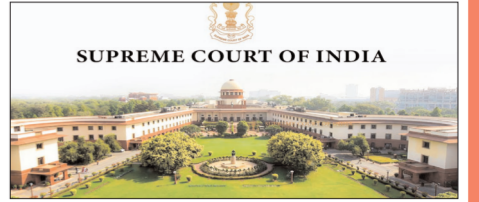
SUPREME COURT OF INDIA

ఏపీ రాజధాని అంశం మరోసారి హాట్ టాపిక్ గా మారింది. మళ్లీ రాజకీయ రచ్చ మొదలైంది. సుప్రీంకోర్టులో రాజధాని అమరావతి కేసు విచారణకు రానుంది. ద్వీపభ్య కమిటీ ధర్యాసనం