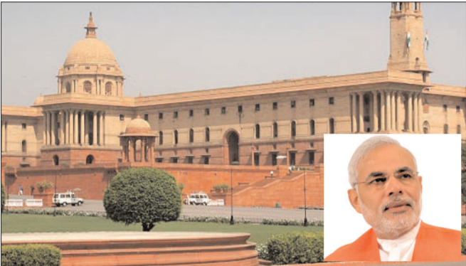
న్యూఢిల్లీ- ప్రభాత సూర్యుడు