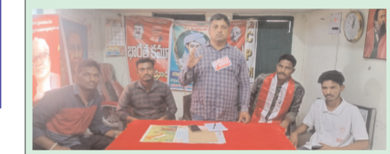
మహబూబాబాద్ - ప్రభాత సూర్యుడు