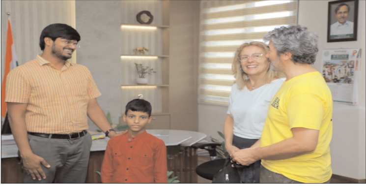
ఖమ్మం- ప్రభాత సూర్యుడు