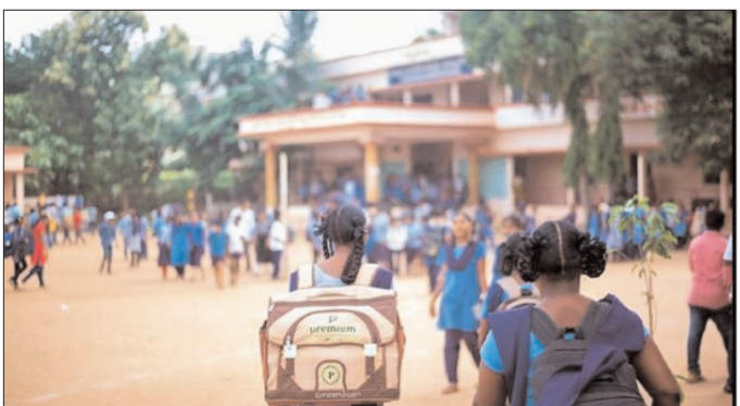
జగిత్యాల - ప్రభాత సూర్యుడు