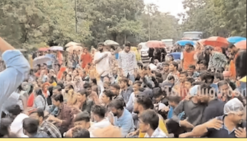
హైదరాబాద్ - ప్రభాత సూర్యుడు