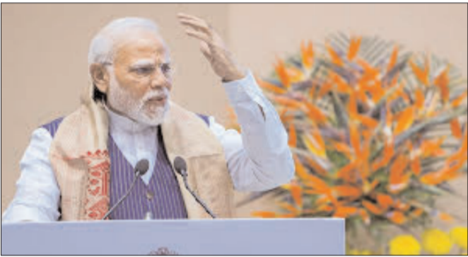
న్యూఢిల్లీ - ప్రభాత సూర్యుడు

ప్రతి పక్షాల ఇండియా కూటమిపై ప్రధాని నరేంద్ర మోదీ