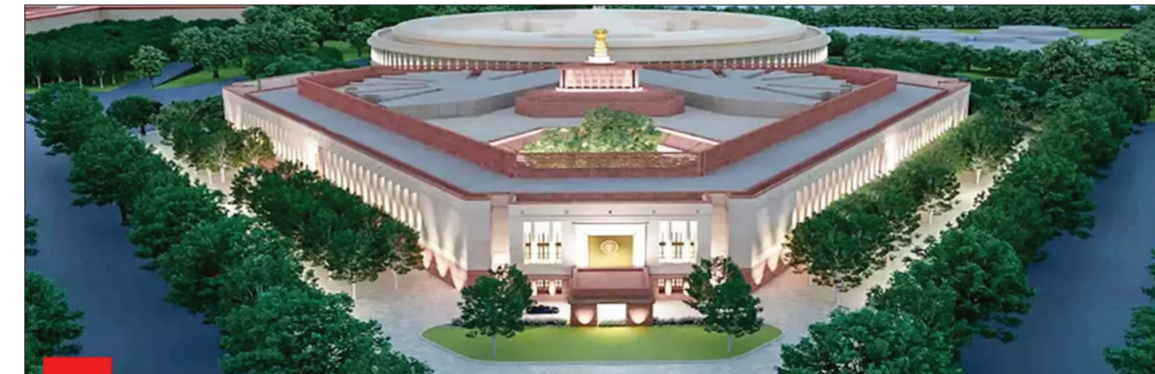
న్యూఢిల్లీ - ప్రభాత సూర్యుడు

పార్లమెంటు వర్షాకాల సమావేశాలు ఈ గురువారం నుంచి ప్రారంభం కానున్నాయి. ఈ సమావేశాల్లో పలు కీలక బిల్లులపై ఉభయసభల్లో చర్చలు జరగనున్నాయి. ఈ సమావేశాలు తొలిసారి పార్లమెంటు సూతన భవనంలో జరగనున్నాయి. పార్లమెంటు సూతన భవనంలోనే ఈ వర్షాకాల సమావేశాలు జరగ నున్నాయి.