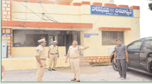
జగిత్యాల - ప్రభాత సూర్యుడు