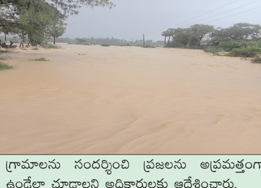
గ్రామాలను సందర్శించి ప్రజలను అప్రమత్తంగా ఉండేలా చూడాలని అధికారులకు ఆదేశించారు.

రానున్న ఇరవైనాలుగు గంటల్లో భారీ నుంచి అతి భారీ వర్షాలు కురుస్తున్నాయన్న వాతావరణ శాఖ సమాచారం తో అధికారులు అలెర్ట్ అయ్యారు. మండలంలోని ముంపు ప్రాంతాల్లో హైదరాబాద్ కలెక్టర్ అనుదీప్ దురిశెట్టి పర్యటించారు. తేగడ వద్ద తాలిపేరు వంశెన వద్ద వరద ప్రవాహం తీవ్రతను పరిశీలించారు. గోదావరి పరివాహక ప్రాంతాల్లో