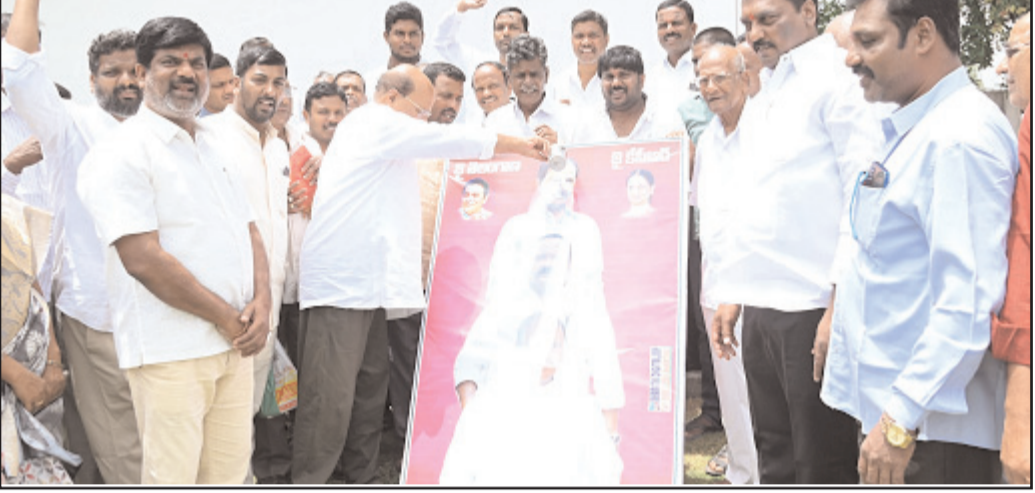
ముఖ్యమంత్రి కేసీఆర్ చిత్రపటానికి రేషన్ డీలర్లతో కలిసి పాలాభిషేకం చేస్తున్న ఎమ్మెల్యే మంచెరెడ్డి

ఇబ్రహీంపట్నం - ప్రభాత సూర్యుడు : రేషన్ డీలర్ల కమిషన్లు పెంచుతూ తెలంగాణ ప్రభుత్వం తీసుకున్న నిర్ణయంతో నియోజకవర్గం లోని రేషన్ డీలర్లు హర్షం వ్యక్తం చేశారు. బుధవారం ఇబ్రహీంపట్నం నియోజకవర్గం క్యాంప్ కార్యాలయంలో రేషన్ డీలర్లు ఎమ్మెల్యే మంచెరెడ్డి కిషన్ రెడ్డితో కలిసి ముఖ్యమంత్రి కేసీఆర్ చిత్రపటానికి పాలాభిషేకం చేశారు. ఈ సందర్భంగా రేషన్ డీలర్ల కమిషన్లు పెంచినందుకుగాను ఎమ్మెల్యే కిషన్ రెడ్డికి కృతజ్ఞతలు తెలియజేశారు. అనంతరం మిఠాయిలు పంచుకున్నారు. ఎమ్మెల్యే మంచెరెడ్డి కిషన్ రెడ్డి మాట్లాడుతూ.. తెలంగాణ ఏర్పడక ముందు రేషన్ డీలర్ల కమిషన్ టన్నుకు కేవలం 200 మాత్రమే ఉండేదని, తెలంగాణ రాష్ట్రం ఏర్పడక ముఖ్యమంత్రి కెసీఆర్ పాలనలో డీలర్ల కమిషన్లు క్రమేణ పెంచుతూ వచ్చిందని తెలిపారు. కానీ ఇప్పుడు రేషన్ డీలర్ల కమిషన్లు దృష్టిలో పెట్టుకొని టన్ను బియ్యానికి ఏకంగా 900 నుండి 1400 రూపాయలకు పెంచుతూ ప్రభుత్వం నిర్ణయం తీసుకోవడం సంతోష