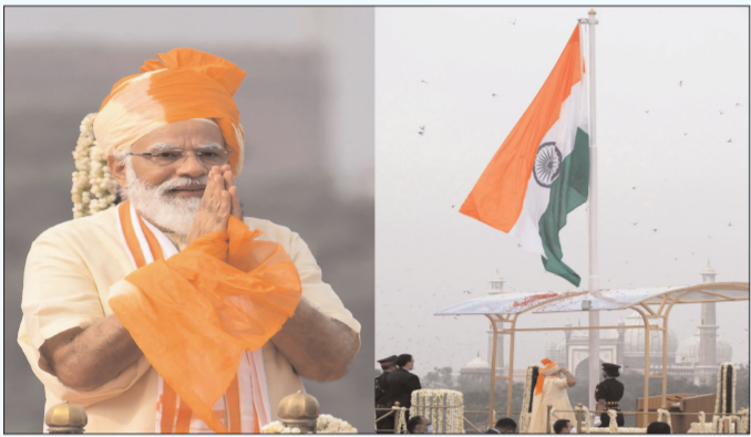
న్యూఢిల్లీ - ప్రభాత సూర్యుడు

యావత్ దేశం 77వ స్వాతంత్ర్య దినోత్సవాలను జరుపుకొంటోంది. దేశం మొత్తం త్రివర్ణ పతాకాలు రెపరెపలాడుతోంది. నేషన్ ఫస్ట్-ఆల్టేన్ ఫస్ట్.. అనే ఢిమ్తో ఈ ఏడాది స్వాతంత్ర్య దినోత్సవాన్ని వైభవంగా జరుపుకోనున్నారు దేశ ప్రజలందరూ. జాతీయ సమగ్రత, దేశాభివృద్ధికి సంకేతంగా ఈ ఢిమ్ను రూపొందించింది ప్రభుత్వం. పండ్రాగస్టు వేడుకల సందర్భంగా ప్రధానమంత్రి నరేంద్ర మోడీ దేశ రాజధానిలోని ఎర్రకోటపై మువ్వన్నెల పతాకాన్ని ఎగురవేశారు. జాతీయ ఉద్దేశించి ప్రసంగించారు. జనాభా, అతిపెద్ద ప్రజాస్వామ్యం, వైవిధ్యం.. అనే