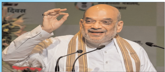
ఖమ్మం - ప్రభాత సూర్యుడు

ఎన్నికల సమరభేరి మోగించడానికి కాపాయి పార్టీ రెడీ అవుతోంది. ఈ నెల 27న ఖమ్మం జిల్లాలో కేంద్ర హోం మంత్రి అమిత్ షా పర్యటించబోతున్నారు. భద్రాచలం రామమ్మి సన్నిధి నుంచి సమరశంఖం పూరించాలని కమలనాథులు భావిస్తున్నారు.