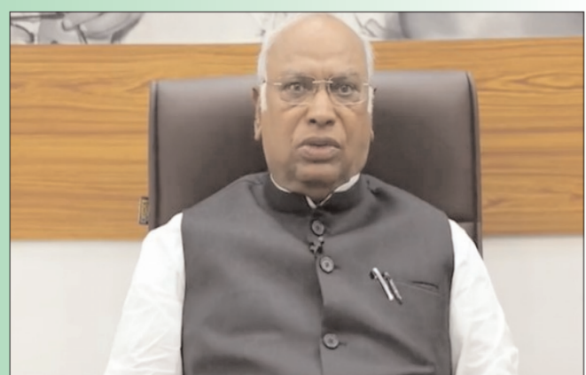
న్యూఢిల్లీ - ప్రభాత సూర్యుడు

ఎర్రకోటలో 77వ స్వాతంత్ర్య దినోత్సవ వేడుకలు ఘనంగా జరిగాయి. ఎర్రకోటలో జరిగిన స్వాతంత్ర్య దినోత్సవ వేడుకలకు కాంగ్రెస్ పార్టీ జాతీయ అధ్యక్షులు, రాజ్యసభలో ప్రతిపక్ష నేత అయిన మల్లికార్జున ఖర్గే గైర్జాబరయ్యారు. ఎర్రకోటలోని స్వాతంత్ర్య దినోత్సవ వేడుకలకు ఖర్గే హాజరు కాకపోవడానికి కారణాలను కాంగ్రెస్ పార్టీ అధికారికంగా ప్రకటించబోయినప్పటికీ.. ఆరోగ్యం బాగా లేక తాను హాజరు కాలేదని ఖర్గే తన ట్విట్టర్ ఖాతాలో పోస్టు చేశారు. ఎర్ర కోటలో జరిగిన స్వాతంత్ర్య వేడుకలకు