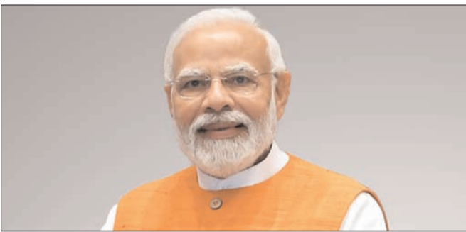
హైదరాబాద్ - ప్రభాత సూర్యుడు

దేశంలో రైల్వే స్టేషన్ల సామర్థ్యాన్ని పెంచడం, ప్రయాణీకుల అవసరాలకు తగ్గట్టుగా అధునాతన సౌకర్యాలతో ఆధునీకరించడం కోసం కేంద్ర ప్రభుత్వం 'అమృత్ భారత్ స్టేషన్ల' పథకాన్ని ప్రారంభించిన సంగతి తెలిసిందే. దేశవ్యాప్తంగా జరుగుతున్న ఈ కార్యక్రమంలో భాగంగా.. తెలంగాణలో మొత్తం 39 స్టేషన్లను గుర్తించి వీటిని సంపూర్ణంగా ఆధునీకరించాలని నిర్ణయించారు. ఇందులో మొదటి విడతగా తెలంగాణ నుంచి 21 స్టేషన్లకు సంబంధించిన పనులు ఆగస్టు 6వ తేదీన ప్రధానమంత్రి సరేంద్రమోదీ గారి చేతుల మీదుగా ప్రారంభం కానున్నాయి.