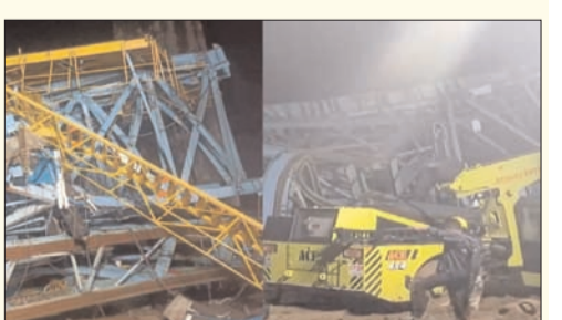
ముంబై - ప్రభాత సూర్యుడు

మహారాష్ట్రలో మంగళవారం ఉదయం తెల్లవారుజామున ఘోర ప్రమాదం జరిగింది. ధానేలోని షాపూర్లో.. భారీ క్రేన్ (గర్డర్?) ఒక్కసారిగా కుప్పకూలి 16 మంది మృత్యువాత పడ్డారు. మరో ముగ్గురు తీవ్రంగా