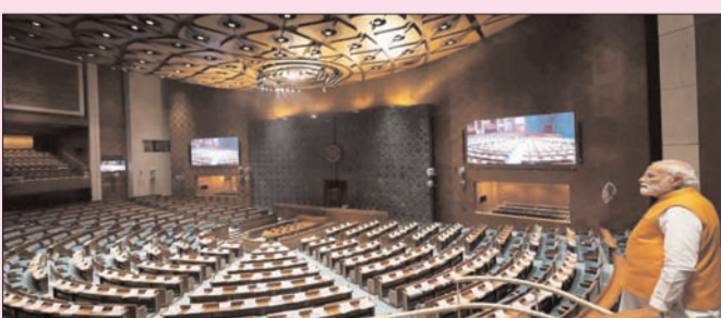
న్యూఢిల్లీ - ప్రభాత సూర్యుడు

మణిపూర్లో జరుగుతున్న ఘర్షణలపై ప్రతిపక్షాలు ప్రవేశపెట్టిన అవిశ్వాస తీర్మానాన్ని పార్లమెంట్ వచ్చే వారం చర్చించబోతుంది. ఆగస్టు 8వ తేదీ నుంచి 10వ తేదీ వరకు లోక్ సభలో చర్చ జరుగుతుందని, ఆగస్టు 10న అవిశ్వాస తీర్మానానికి ప్రధాని సరేంద్ర మోదీ సమాధానం చెబుతారని అధికార పక్షం తెలిపాయి. జూలై 20న పర్యటన సమావేశాలు ప్రారంభమైనప్పటి నుంచి పార్లమెంటు ఉభయ సభల్లో నిరంతర గందరగోళం జరుగుతోంది. దీనికి ప్రధాన కారణం మణిపూర్ లోని హింసాకాండనే. మణిపూర్ పరిస్థితిపై చర్చకు హోంమంత్రి అమిత్ షా సమాధానం ఇస్తారని ప్రభుత్వం చెప్పినప్పటికీ..