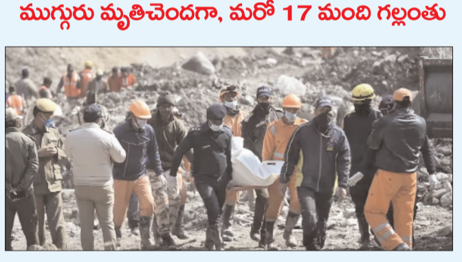
కేదార్ నాథ్ - ప్రభాత సూర్యుడు