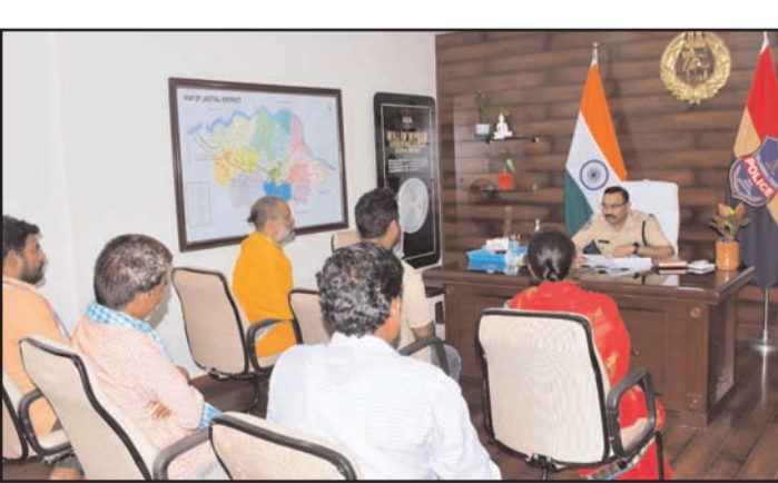
తెలుసుకొని సంబంధిత అధికారులతో ఫోన్ లో మాట్లాడి బాధితులకు సత్వర న్యాయం జరిగేలా చూడాలని అధికారులను ఆదేశించారు. గ్రీవెన్స్ డే

జగిత్యాల - ప్రభాత సూర్యుడు: బాధితులకు సత్వర న్యాయం జరిగేలా చూడాలని రీజనల్ పోలీస్ జిల్లా ఎస్పీ భాస్కర్ ఆదేశించారు. అనేక రకాల సమస్యలతో పోలీసులను ఆక్రమించే బాధితులకు సత్వర న్యాయం చేసే విధంగా చర్యలు తీసుకోవడమే గ్రీవెన్స్ డే ముఖ్య లక్ష్యమని జిల్లా ఎస్పీ అన్నారు. ప్రతి సోమవారం ప్రజల సౌకర్యార్థం నిర్వహించే గ్రీవెన్స్ డే లో బాగంగా సోమవారం జిల్లా పోలీసు కార్యాలయంలో జిల్లాలోని వివిధ ప్రాంతాల నుండి వచ్చిన దాదాపు 29 మంది అర్జీదారులతో నేరుగా మాట్లాడి వారి సమస్యలను