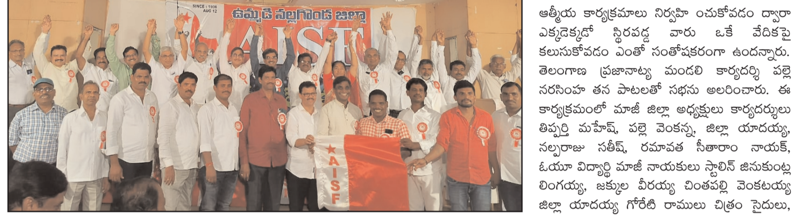
- ఆత్మీయ సమ్మేళనం సభలో అభివాదాలు తెలియజేస్తున్న ఏబిఎస్ఎఫ్ మాజీ విద్యార్థి నాయకులు