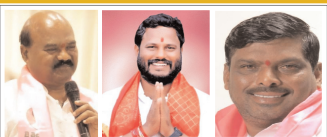
తెలంగాణ బ్యూరో - ప్రభాత సూర్యుడు