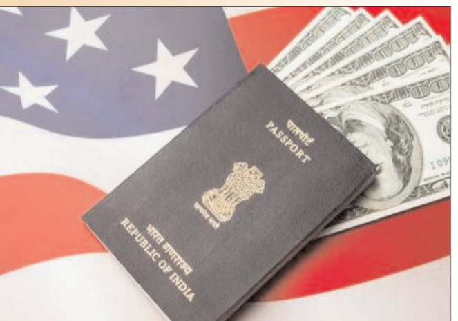
ముంబై - ప్రభాత సూర్యుడు