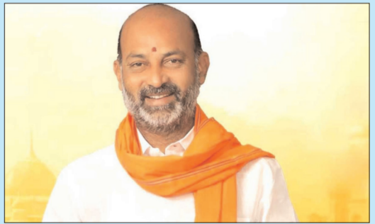
కరీంనగర్ - ప్రభాత సూర్యుడు

బీజేపీ జాతీయ ప్రధాన కార్యదర్శి, ఎంపీ బండి సంజయ్ కుమార్ వ్యాఖ్యలు