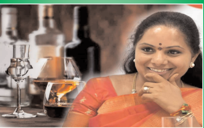
న్యూఢిల్లీ - ప్రభాత సూర్యుడు