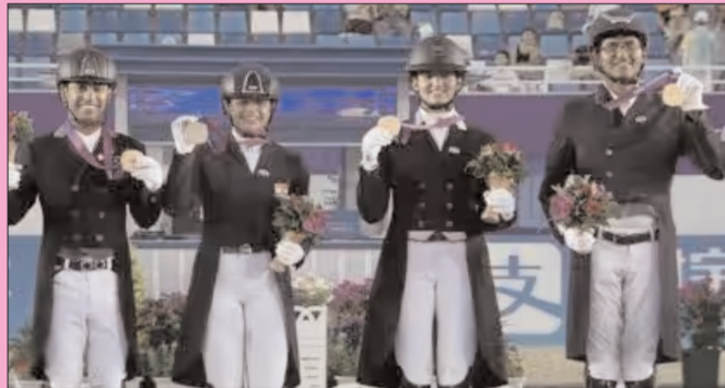
ముంబై - ప్రభాత సూర్యుడు