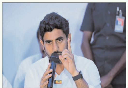
న్యూఢిల్లీ - ప్రభాత సూర్యుడు