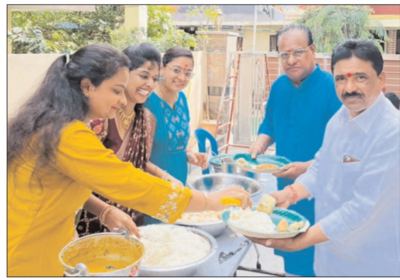
స్వామివారిని దర్శించుకుని, స్వామివారి ఆశీస్సులు, పొందాలని కమిటీ సభ్యులు తెలిపారు.