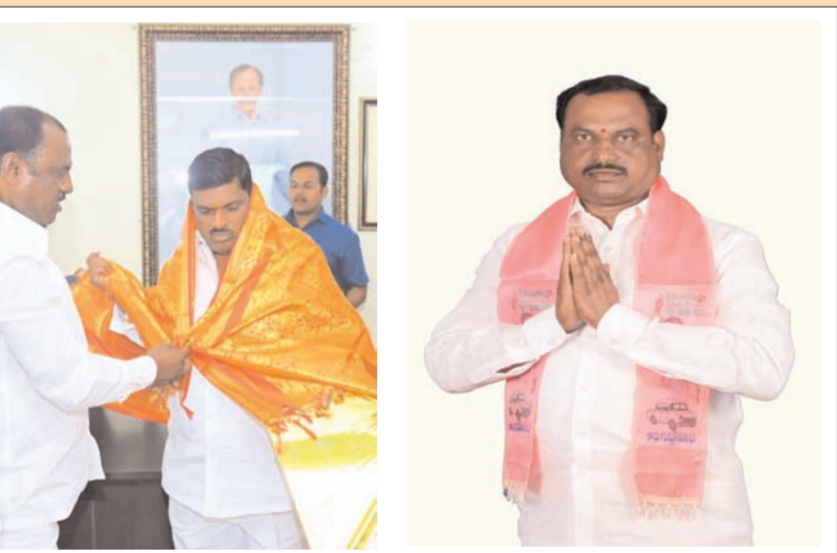
పటాన్ చెరు - ప్రభాత సూర్యుడు