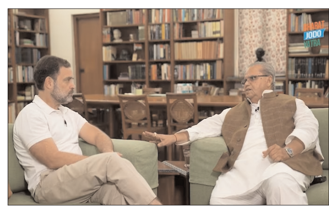
హైదరాబాద్ - ప్రభాత సూర్యుడు

తెలంగాణ అసెంబ్లీ ఎన్నికలు దగ్గరపడుతున్నాయి. దీంతో ప్రధాన పార్టీలన్నీ వ్యూహాలకు పదునుపెడుతున్నాయి. ఎలాగైనా అధికారంలోకి రావాలని ప్రయత్నిస్తున్న కాంగ్రెస్ పార్టీ దూకుడు పెంచింది. ప్రజలను ఆకట్టుకునేందుకు ఆరు హామీలను ప్రకటించిన కాంగ్రెస్ పార్టీ.. తొలివిడతలో 55 మంది అభ్యర్థులను ప్రకటించింది. ఆ తర్వాత.. ఎన్నికల సంగ్రామంలో ఆపార్టీ అగ్రనేతలే రంగంలోకి దిగారు. తొలివిడత ప్రచారంలో భాగంగా రాహుల్ గాంధీ, ప్రియాంక గాంధీ