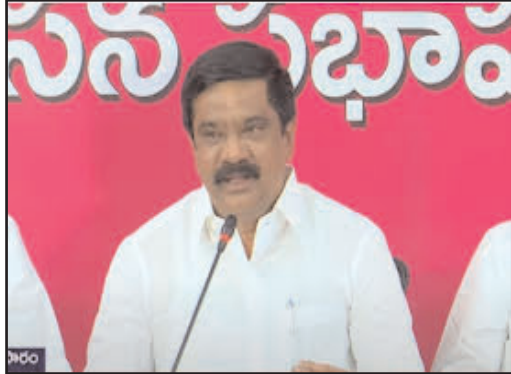
బోధన - ప్రభాత సూర్యుడు

నిజామాబాద్ జిల్లా బోధన్ నియోజకవర్గం సవీపేట్ మండలంలో రాష్ట్ర రోడ్డు భవనాలు శాఖ మంత్రి వేముల ప్రశాంత్ రెడ్డి వ్యక్తిగత కార్యక్రమం మీద బుధవారం తన బంధువుల ఇంటికి రాగా స్థానిక మీడియా ప్రతినిధులు ఆయనతో ముచ్చటించారు. తన తల్లి మరణానంతరం మొదటి సారి బయటకు వచ్చిన ఆయన అక్కడే మీడియాతో మాట్లాడారు. తాజా రాజకీయ పరిణామాలు, బిఆర్ఎస్ మేనిఫెస్టో పై ఆయన స్పందించారు. కేసీఆర్ గారి పాలనలో అన్ని వర్గాల ప్రజలు సుఖిక్షంగా ఉన్నారని మంత్రి వేముల పేర్కొన్నారు. కేసీఆర్ సర్కార్ హక్కుల్ని విజయం ఎప్పుడో ఖాయమయ్యిందని అన్నారు. అస్తవ్యస్తమైన కరెంట్ తో తెలంగాణ ప్రజలు గోసలు పడ్డారని, దాన్ని దృష్టిలో పెట్టుకొని కేసీఆర్ గారు సుమారు లక్ష కోట్లతో కరెంట్ వ్యవస్థను గాడిలో పెట్టాడని తెలిపారు. రైతుకు 24 గంటల ఉచిత విద్యుత్, గృహ అవసరాలకు, పరిశ్రమలకు నిరంతరాయంగా నేడు కరెంట్ సరఫరా అవుతుందన్నారు. తెలంగాణ ప్రజలకు కరెంట్ కష్టం బాధలు తొలగించింది కేసీఆర్ అని మంత్రి స్పష్టం చేశారు. రైతుకు రైతు బంధు, రైతు భీమా, సాగునీరు, సకాలంలో ఎరువులు ఇచ్చి, కొనుగోలు కేంద్రాలు ఏర్పాటు చేసి రైతు బాంధవుడుగా నిలిచారని కొనియాడారు. నేడు తెలంగాణలో రైతులు తన పక్క పొలం రైతుతో