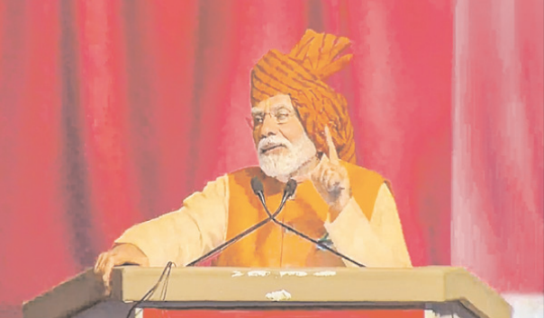
న్యూఢిల్లీ - ప్రభాత సూర్యుడు

కులతత్వాన్ని, ప్రాంతీయవాదాన్ని సమాజం నుంచి కూకటివేళ్లతో పెకిలించివేయాలని ప్రధానమంత్రి నరేంద్ర మోడీ పిలుపునిచ్చారు. దేశంలోని ప్రతి చెడుపై దేశభక్తి సాధించిన విజయానికి గుర్తుగా ఈ దసరా పండుగ ఉండాలని ఆయన ఆకాంక్షించారు. న్యూఢిల్లీలోని ద్వారకాలో మంగళవారం జరిగిన దసరా ఉత్సవాల్లో పెద్ద సంఖ్యలో పాల్గొన్న ప్రజలను ఉద్దేశించి మోడీ ప్రసంగించారు. శతాబ్దాల ఎదురుచూపుల తర్వాత అయోధ్యలో రామమందిరం నిర్మాణం జరుగుతుండటం ప్రజల అభ్యుత్థమని ఆయన చెప్పుకొచ్చారు. త్వరలోనే మందిరం పూర్తవుతుందని, ఇది ప్రజల సహనానికి దక్షిణ విజయమని మోడీ చెప్పారు.