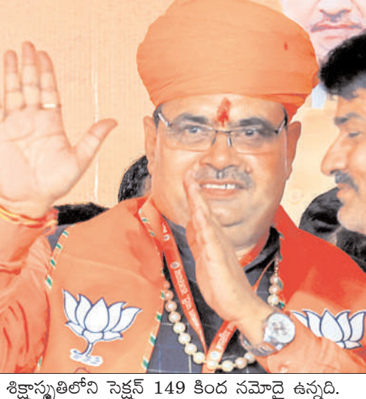
భారతీయ శిక్షాస్ఫూటిలోని సెక్షన్ 149 కింద సమోదై ఉన్నది.