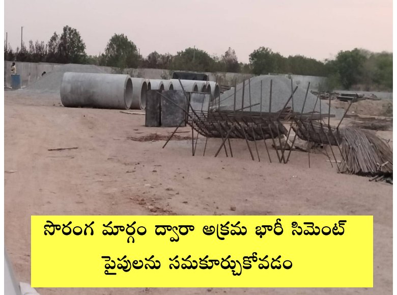
సొరంగ మార్గం ద్వారా అక్రమ భారీ సిమెంట్ పైపులను సమకూర్చుకోవడం

అధికారులు భారీ ఎత్తున ముడుపులు తీసుకొని రైతుల వంట పొలాల నుంచి మరో అక్రమ సొరంగం పైప్ లైన్ మార్గం వేస్తున్నారు. అంతకుముందే ఎనిమిది ఫీట్ లోతు నుండి సొరంగ మార్గం ద్వారా రిలయన్స్ గ్యాస్ పైప్ లైన్ వేయడం జరిగింది. మళ్ళీ ఇప్పుడు కొత్త సొరంగ మార్గం ద్వారా రిలయన్స్ గ్యాస్ లైన్ కు అతి దగ్గరలో మరొక సిమెంటు పైపులతో అతిపెద్ద పైపులైను సొరంగ మార్గం ద్వారా వేస్తున్నట్లు రుద్రారం గ్రామ రైతులు చెప్పన్నారు. ఇదే జరిగితే వచ్చే రోజులలో భూగర్భంలో వేడిని తట్టుకోక అగ్ని ప్రమాదాలు జరిగే అవకాశం ఉందని అన్నారు. దీనికి ఇరిగేషన్ శాఖ అధికారుల అండదండలు సంపూర్ణంగా ఉన్నాయని అన్నారు. ఈ భారీ ప్రాజెక్టుపై విచారణ జరిపి దోషులను శిక్షించాలని గొలుసు కట్టు కాలువను కాపాడాలని వచ్చే వర్షం కాలంలో వర్షం నీరు ముందుకు వెళ్లక మళ్ళీ వెనుకకు తిరిగి వచ్చి తమ వంట పొలాలకు నష్టం వాటిల్లే ప్రమాదం ఉన్నదని రైతులు అంటున్నారు.