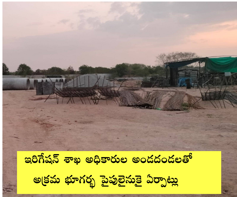
ఇరిగేషన్ శాఖ అధికారుల అండదండలతో అక్రమ భూగర్భ పైపులైనుకై ఏర్పాట్లు