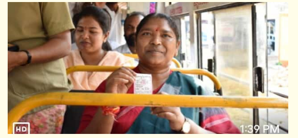
ములుగు - ప్రభాత సూర్యుడు

జీరో టికెట్ తో ఆర్టీసీ బస్సులో ప్రయాణించిన మంత్రి సీతక్క