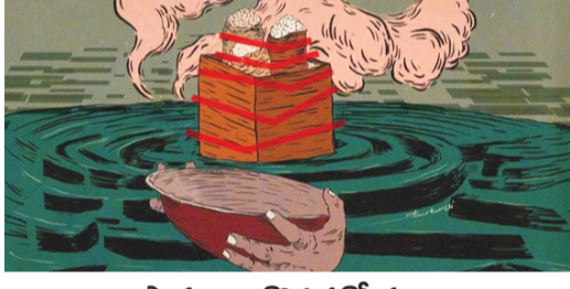
సాకార్యాల కొరతతో వృధా

న్యూఢిల్లీ : దేశంలో ఆహార ధరలపై సరైన కోణంలో విశ్లేషణ జరగడం లేదు. ముఖ్యంగా ఆహార భద్రత కోణం నుంచి ఈ సమస్యను పరిశీలించాలని పలువురు నిపుణులు సూచించారు. ఆహార సరిగ్గా లభించక పోవడం వల్లనే కరువు కాలాలు సంభవించడం లేదని, సామాజిక, ఆర్థిక అసౌకల్య కూడా దానికి దోహద పడుతున్నాయని చాలా ఎండ్ర క్రితమే అభివేక్షి అమర్చుకొని తెలిపారు. ఈ నిర్ణయం నేటికీ చెల్లుబాటు అవుతుంది. రాజీయే కాలంలో పౌష్టికాహార లోపం కుటుంబాల ఆర్థిక వనరులపై ప్రభావం చూపబోతోంది. వాతావరణంలో వస్తున్న మార్పుల కారణంగా భవిష్యత్లో ఆహార భద్రతకు అనేక సూక్ష్మ ఎదురవుతాయని నిపుణులు హెచ్చరించారు. నేడు దేశంలో పోషకాహార లోపం తరచూరానికి హరిత విప్లవ వైరుధ్యాలలో ఒకటి పాక్షికంగా కారణం అవుతోంది. హరిత విప్లవం కారణంగా బియ్యం, నీరు, పప్పు, దాణాలు ఉత్పత్తి గణనీయంగా పెరిగింది. ముఖ్యంగా 1950-2007 మధ్యకాలంలో ఆహార ధాన్యాల ఉత్పత్తి ఏటా 2.5 శాతం వృద్ధి చెందింది. ఫలితంగా మన దేశం బియ్యం, గోధుమలను ఎగుమతి చేయడం ప్రారంభించింది. అయితే ప్రజా పంపిణీ వ్యవస్థ ద్వారా పేదలకు కేవలం ఆహార ధాన్యాలను మాత్రమే అందిస్తున్నారని తప్పించి అవసరమైన పప్పు ధాన్యాలు, పండ్లు, కూరగాయలు సరఫరా చేయడం లేదు. ఫలితంగా ప్రజల్లో పోషకాహార లోపం ఏర్పడింది.