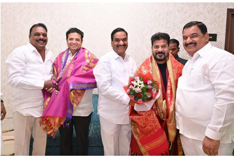
హైదరాబాద్, (ప్రభాత సూర్యుడు) : తెలంగాణ సీఎం రేవంత్ రెడ్డి బృందం విదేశీ పర్యటనను ముగించుకుని హైదరాబాద్ చేరుకుంది. అమెరికా, దక్షిణకొరియాలో

- శంషాబాద్ లో ఘనంగా స్వాగతం పలికిన కాంగ్రెస్ శ్రేణులు