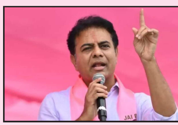
హైదరాబాద్, (ప్రభాత సూర్యుడు) : కాంగ్రెస్ పాలనలో.. పల్లెలు, పట్టణాలు కంపు కొడుతున్నాయని బీఆర్ఎస్ వర్కింగ్ ప్రెసిడెంట్ కేటీఆర్ మండిపడ్డారు. ఓవైపు తెలంగాణ పల్లెల్లో

పాలన పూర్తిగా పడకేసింది.. మరోవైపు పట్టణాల్లో పరిస్థితి అధ్వాన్నంగా మారింది.. ప్రజా పాలన అంటే ప్రజల ప్రాణాలతో చెలాగటం ఆడటమేనా..? అని కాంగ్రెస్ ప్రభుత్వాన్ని కేటీఆర్ సూటిగా ప్రశ్నించారు. అటు కేంద్రం నుంచి, ఇటు రాష్ట్ర ప్రభుత్వం నుంచి రావాల్సిన నిధులు నిలిచిపోవడంతో పంచాయతీలు తీవ్ర సంక్షోభంలో కొట్టు మిట్టాడు తున్నాయి. పాత పనులకు ఎనిమిది నెలలైనా బిల్లులు చెల్లించకపోవడంతో అప్పులు ఊటిలో కూరుకు పోయిన తాజా మాజీ సర్పంచ్ల పరిస్థితి అగమ్యగోచరంగా మారింది. పారిశుధ్యం, డ్రైనేజీ నిర్వహణ అధ్వాన్నంగా మారడంతో.. పల్లెల్లో ప్రజల జీవనం దినదిన గండంలా మారింది. దోమల మందుకు