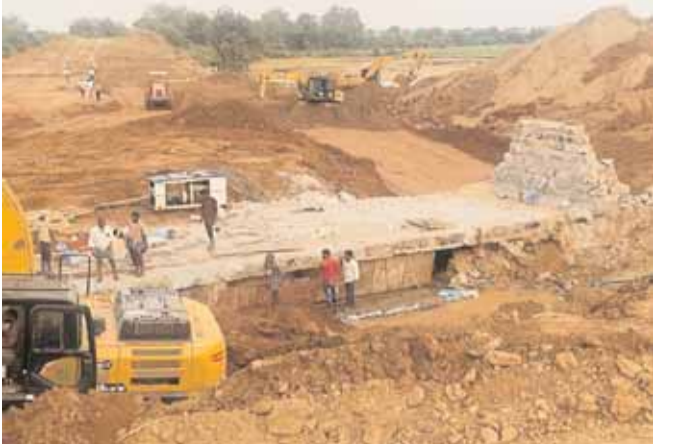
ఆయకట్టు రైతులకు నీరు అందించాలని ఆదేశించారు. తుమ్మల ఫోటో మ్యాటర్ మధ్యలో రౌండ్ గా రావాలి. అలాగే సైట్ ఫోటో పెద్దగా రావాలి ఏలైతే మొయిన పేసర్ లో ట్రింట వెయ్యగలరు.

కు సూచించారు. కాలువ మరమ్మత్తులు పనులు సత్వందకన సాగుతూ ఉండటంతో మంత్రి తుమ్మల అధికార యంత్రాంగంపై తీవ్ర ఆగ్రహం వ్యక్తం చేశారు. రైతాంగం కు నష్టం లేకుండా పంటలు ఎండి పోకుండా ఇరిగేషన్ అధికారులు రెండు రోజుల్లో మరమ్మత్తు పనులు పూర్తి చేసి సాగర్ ఆయకట్టు కు నీరు విడుదల చేయాలని మంత్రి తుమ్మల సూచించారు. అధికారుల నిర్లక్ష్యం వల్ల ఏ ఒక్క రైతుకు ఇబ్బంది కలగకూడదని సూచించారు. యుద్ధ ప్రాతిపదికన పనులు చేపట్టేందుకు అవసరమైన అన్ని చర్యలు తీసుకొని సాగర్