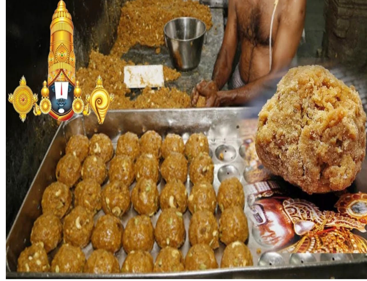
చేస్తారని వివరించారు. అబద్ధాలను ప్రచారం చేయడం ద్వారా తిరుమల పవిత్రతను దెబ్బతీస్తున్నారని వైఎస్ జగన్ అన్నారు. మన తిరుమలను మనమే తక్కువ చేసుకుంటున్నామని అన్నారు. లద్దా

లద్దా తయారీలో వాడే నెయ్యిలో జంతువుల కొవ్వు ఉందనేది ఒక కట్టు కథ అని కొద్దిపాటికే. దశాబ్దాలుగా జరుగుతున్న పద్ధతుల్లోనే తిరుమలలో లద్దా తయారీ జరుగుతోందని అన్నారు. దేవుడిని కూడా రాజకీయాలకు వాడుకునే దుర్మార్గమైన మనస్తావన చంద్రబాబు అని విమర్శించారు. భక్తుల మనోభావాలతో ఆడుకోవడం ధర్మమేనా? అని ఆయన ప్రశ్నించారు. ప్రతి 6 నెలలకు ఒకసారి నెయ్యి సరఫరా కోసం టెండరు పిలువాలని, చంద్రబాబు ముఖ్యమంత్రిగా ఉన్న సమయంలోనే నెయ్యి శాంపిల్స్ తీసుకున్నారని, జులై 23న రిపోర్ట్ వస్తే ఇప్పుడు చంద్రబాబు మాట్లాడడం విద్వేషం అని మండిపడ్డారు. ఎప్పుడీ లాగా ఒకే విధానంలో లద్దా తయారీ సామగ్రి కొనుగోలు ప్రక్రియ జరుగు తోందని చెప్పారు. నెయ్యి నాణ్యత నిర్ధారణ పరీక్ష విధానాలను ఎవరూ మార్చలేదని, ఇంత దుర్మార్గమైన పని ఎవరైనా చేయగలరని అని అన్నారు. ఒక సీఎం ఇలా అబద్ధాలు ఆడటం ధర్మామేనా అని జగన్ మండిపడ్డారు. జులై 17న ఎన్ టీడీపీకి నెయ్యి శాంపిల్స్ పంపించారని, జులై 23న రిపోర్ట్ వస్తే చంద్రబాబు ఇప్పటివరకు ఏం చేశారు?. ఎందుకు బయటకు చెప్పలేదని ప్రశ్నించారు. జగన్గనది జరిగినట్లు చంద్రబాబు చెబుతున్నారని జగన్ పేర్కొన్నారు. నెయ్యి షాంపిల్స్ ప్రతి ట్యాంకర్ సర్టిఫికేట్ తీసుకోవాలని, ప్రతి ట్యాంకర్ శాంపిల్స్ ను మూడుసార్లు టెస్ట్