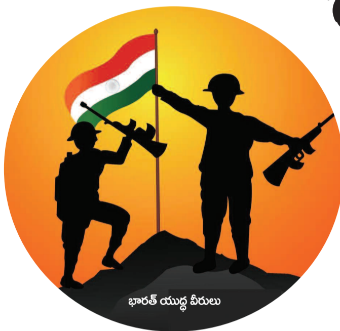
భారత్ యుద్ధ వీరులు