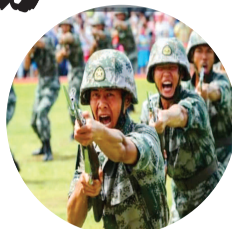
భారత్కు ప్రధాన శత్రుదేశం చైనా

హైదరాబాద్, అక్టోబర్ 15 (ప్రభాత సూర్యుడు): భారత్కు రెండు ప్రధాన శత్రు దేశాలు ఉన్న సంగతి ప్రపంచ దేశాల్నింటికి తెలుసు. 1.చైనా 2. పాకిస్తాన్ మన దేశం పక్కలో ఉన్న పాకిస్తాన్ ను భారత్ ఎదురుకోవడం అంటే “మన హెంగాల్ అస్సలు” ఆధునిక తుపాకులు ఇచ్చి పంపిస్తే, పాకిస్తాన్ ను తుక్కుతుక్కు చేసి వచ్చేంత సమర్థులు, మన హెంగాల్ అస్సలు. పాకిస్తాన్ మనకు పెద్ద శత్రుదేశం గా చూడడం అంటే మనని మనం తక్కువ చేసుకున్నట్లే!!! ఆర్థిక, శాస్త్ర, సాంకేతిక, రక్షణ మిలటరీ, (సైనిక సంపత్తి) ఆధునిక అణుబాంబులతో కూడుకున్న దేశం మనది. జనాభా పరంగా ప్రపంచంలోనే రెండో స్థానంలో ఉన్న దేశం మనది. అందుకే పాకిస్తాన్ మనకు పెద్ద శత్రుదేశం కాదు. ఇక చైనా విషయానికి వస్తే దేశ రక్షణ రంగంలో, ఆర్థిక, శాస్త్ర, సాంకేతిక రంగాలలో, సముద్ర గర్భ యుద్ధ టాంకర్లలో, ప్రపంచ ఆధునిక రాధార్ తయారీలో మనము చైనా కంటే వెనుకబడి ఉన్నాము. అలాగే వైమానిక, మిలటరీ ఆర్మీ, సముద్ర, వాయుసేన సముద్ర గర్భంలోని, జలక్రిమిల యుద్ధ ట్యాంకర్ల విషయంలో చైనా కంటే యుద్ధ సామర్థ్యంలో మనము వెనుకబడి ఉన్నాము. అనే విషయము మాజీ తెలంగాణ ఐటీ శాఖ మాతృశాఖ కేటీఆర్ గుర్తించాలని గుర్తు చేస్తున్నాము. దేశ రక్షణ రంగ విషయంలో భారతదేశం చైనా కంటే వెనుకబడి ఉన్నామన్న విషయం అమెరికా లో గొప్ప గా చదువుకొని తెలంగాణ ఉద్యమాన్ని హైజాక్ చేసి, తండ్రి కేసీఆర్ ముఖ్యమంత్రి కావడంతో తెలంగాణకు దొడ్డిదారిన ఐటీ మంత్రిగా పనిచేసిన కేటీఆర్ కు తెలియక పోవడం చాలాకరం. అందుకే కేటీఆర్ కు అనుభవం రాని అమెరికా చదువులు అనాల్చి వస్తుంది. వికారాబాద్ దామగుండం నేవి రాడార్ స్టేషన్ గత కేసీఆర్ 10 సంవత్సరముల ప్రభుత్వ హయాంలోనే అడుగులు వద్ద విషయం దాచిపెట్టి ఇప్పుడు బి ఆర్ ఎస్ పార్టీ వ్యతిరేకం అనడం రాజకీయాలు చేయడం కాదా???? అని విమర్శకులు