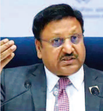
RAJIV KUMAR CHIEF ELECTION COMMISS

మహారాష్ట్రలో నవంబర్ 20న ఒకే విడతలో పోలింగ్ జార్ఖండ్ లో రెండు విడతల్లో నవంబర్ 13, 20న ఎన్నికలు రెండు రాష్ట్రాల్లోనూ నవంబర్ 23న ఓట్ల లెక్కింపు ఉత్తరప్రదేశ్ లో 9 అసెంబ్లీ స్థానాలకు 13న ఉప ఎన్నిక కేంద్ర ప్రధాన ఎన్నికల కమిషన్ రాజీవ్ కుమార్ వెల్లడి హైదరాబాద్, అక్టోబర్ 15 (ప్రభాత సూర్యుడు): మహారాష్ట్ర, జార్ఖండ్ అసెంబ్లీ ఎన్నికల షెడ్యూల్ ను కేంద్ర ఎన్నికల సంఘం ప్రకటించింది. మహారాష్ట్రలో నవంబర్ 20న ఒకే విడతలో పోలింగ్ జరుగుతున్నట్లు సీఈసీ రాజీవ్ కుమార్ ప్రకటించారు. నవంబర్ 23న ఫలితాలు ప్రకటిస్తారు. గెజిట్ నోటిఫికేషన్ అక్టోబర్ 22న వెలువడుతుంది. నామినేషన్ గెడవు అక్టోబర్ 29న తేదీతో ముగుస్తుంది. నామినేషన్ పరిశీలన అక్టోబర్ 30న జరుగుతుంది. నామినేషన్ ఉపసంహరణ గడువు నవంబర్ 4న తేదీతో ముగుస్తుంది. నవంబర్ 25న తేదీలోగా ఎన్నికలు ముగియాల్సి ఉంటుంది. జార్ఖండ్ అసెంబ్లీ ఎన్నికలు రెండు విడతలుగా జరుగుతున్నట్లు సీఈసీ ప్రకటించారు. తొలి విడత నవంబర్ 13, రెండో విడత నవంబర్ 20న జరుగుతుంది. తొలి విడత ఎన్నికలకు అక్టోబర్ 18న నోటిఫికేషన్ వెలువడుతుంది. అక్టోబర్ 25తో నామినేషన్ గడువు ముగుస్తుంది. అక్టోబర్ ..మిగతా 2లో