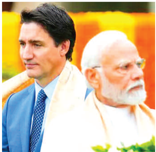
వీడి వెళ్లాలని గడువు విధించింది. ప్రతిగా కెనడా సైతం ఆరుగురు భారత దౌత్యవేత్తలను నిర్ణయించినట్లు తెలిసింది.

న్యూఢిల్లీ, అక్టోబర్ 15 (ప్రభాత సూర్యుడు): ఖలిస్థానీ ఉగ్రవాది హర్జింద్ సింగ్ నిజ్జర్ హత్య జరిగిన దగ్గరనుంచి భారత్తో కయ్యానికి కాలు దువ్వతోన్న కెనడా.. తన బుద్ధి మార్చుకోవడం లేదు. ఇప్పుడు ఏకంగా భారత్పై ఆంక్షలకు సిద్ధమవుతున్నట్లు కనిపిస్తోంది.