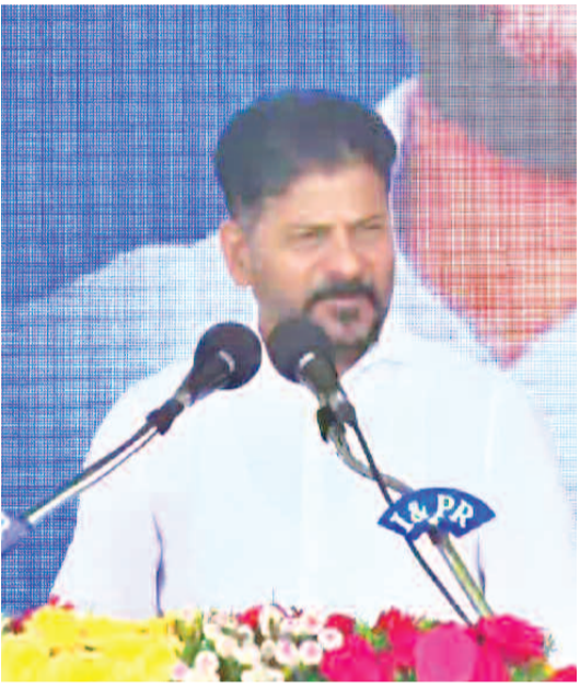
అభివృద్ధి చేయొచ్చు కానీ.. మూసీని అభివృద్ధి చేయొద్దా ఈటలా? కేసీఆర్, హరిష్ చౌదరి మాట్లాడిన జిరాక్స్ కాఫీ తీసుకుని ఈటల మాట్లాడుతున్నారు. పార్టీ మారినా ఈటలకు పాత వాసనలు పోలేదు. మూసీ పరివాహక ప్రాంతాల పేదలకు ఇళ్లు తీసుకురావడానికి మోడి దగ్గరకు వెళ్ళాం రండి... నాకు రావడానికి ఎలాంటి ఖేపజాలు లేవు.. బీఆర్ఎస్, బీజేపీ

రేవంత్ రెడ్డి ఆరోపించారు. ఆ తర్వాత... అప్పులను సరిదిద్దుతూ ముందుకు వెళ్తున్నామని అన్నారు. పదేళ్లు అధికారంలో ఉన్నవారు కంట్రోవర్సీల సమస్యలను ఎందుకు పరిష్కరించలేదని ప్రశ్నించారు. తాము అధికారంలోకి వచ్చాక కేంద్రానికి భూ బదలాయింపు ద్వారా కంట్రోవర్సీల ప్రజలకు ఇళ్ల పట్టణలు ఇవ్వాలని నిర్ణయం తీసుకున్నామని తెలిపారు. కల్యాణం కుటుంబం అధికారంలో పాటు వివక్షణ కొల్పోయిందని ఎద్దేవా చేశారు. పదేళ్లు నిరుద్యోగుల ఉసురు పోసుకున్నారని ముఖ్యమంత్రి రేవంత్ రెడ్డి దృఢమెత్తారు. అందుకే ప్రజలు కేసీఆర్ ఉద్వేగం ఊడగొట్టారని ఎద్దేవా చేశారు. తాము అధికారంలోకి వచ్చాక ఉద్వేగ నివారణలు చేపట్టామని స్పష్టం చేశారు. మూసీ మురుగులో బతుకుతున్న పేదలకు ఇళ్లు, రూ.25వేలు ఇచ్చి వారి ఆర్థిక సమస్యలను పరిష్కరిస్తామని, బీఆర్ఎస్ నేతల ఫౌండేషన్లను కాపాడుకోవడానికి పేదల ముసుగు అడ్డం పెట్టుకుంటున్నారని, మాజీ మంత్రి కేసీఆర్ అక్రమంగా నిర్మించిన ఫౌండేషన్లు కూల్చాలా వద్దా? మాజీ మంత్రి సబితా ఇంద్రారెడ్డి ముగ్గురు కొడుకులకు ఫామ్ హౌస్లు ఉన్నాయి. వాటిని కూలగొట్టాలా వద్దా? ఫౌండేషన్లు కూలుతాయనే పేదలను అడ్డు పెట్టుకుంటున్నారని, నల్లచెరువులో, మూసీనది ఒడ్డున ఫ్లాట్లు చేసి అమ్మింది బీఆర్ఎస్ పార్టీ నాయకులు కాదా? 20వేళ్లు ప్రజల్లో తిరిగిన వాల్మీకి నాకు పేద ప్రజల కష్టాలు తెలియదా? మూసీని అడ్డుపెట్టుకుని ఎంతకాలం తప్పించుకుంటారు? జవహర్ నగర్లో 1000 ఏకరాలు ఉంది... రండి పేదలకు పంచే ఇందిరమ్మ ఇళ్లు కట్టిస్తాం. ఇక్కడి ఎంపీ ఈటల రాజేందర్ ప్రధానమంత్రి సరేంద్ర మోడి దగ్గర నుంచి ఏం తీసుకువస్తారో చెప్పాలి. సబర్బన్ రివర్ ప్రాజెక్టు