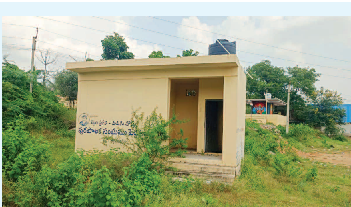
తల్లి అన్నారం 13వ వార్డు హనుమాన్ నగర్లో నిరుపయోగంగా పడిఉన్న మరుగుదొడ్డు