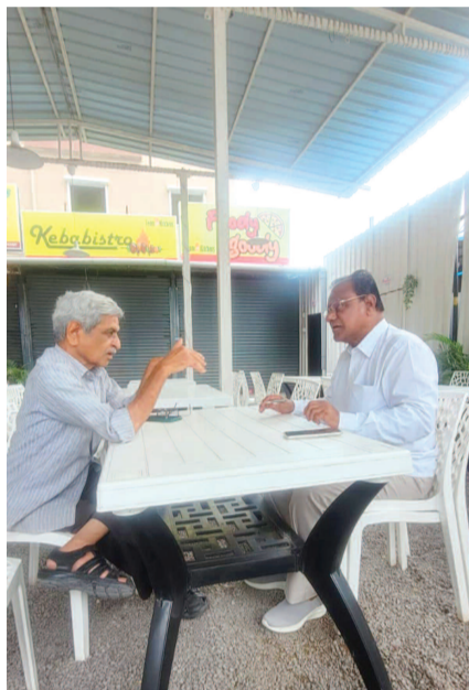
హైదరాబాద్ ప్రభుత్వం పునరుద్ధరించిన పాల్వంచ తలంకా ప్రజలకు ఓ శాస్త్రీయ పరిశోధన అందించిన ముఖ్యమంత్రి రేవంత్ రెడ్డి

సీఎం రేవంత్ రెడ్డి డ్రీమ్ ప్రాజెక్ట్పై ఓ శాస్త్రీయ పరిశోధన